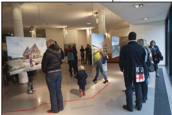
Opening expositie 'Randverschijningen, het leven op de stadsrand' in RO/EZ