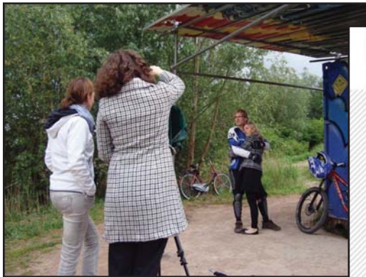
Tijdens fotosessie op Kardingebult