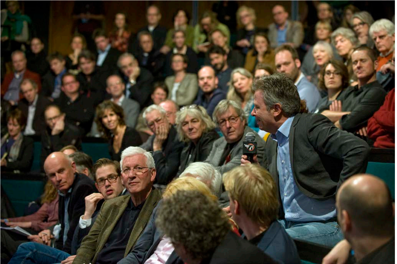
De zaal discussieert mee