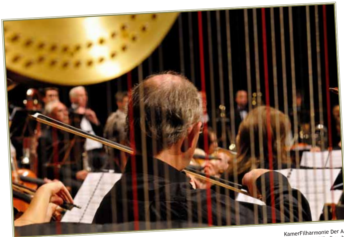
KamerFilharmonie Der Aa Windkracht

Kammingafonds, het Landbouwfonds, het Ben Remkes Cultuurfonds, de Emmaplein Foundation en het Beringer Hazewinkel Fonds. Wie een globaal idee wil laten toetsen of een plan aan meerdere fondsen tegelijk wil presenteren kan op afspraak een presentatie geven en krijgt meteen feedback. Zo weten aanvragers snel voor welke fondsen zij in aanmerking zouden kunnen komen of hoe zij hun kansen op subsidie kunnen vergroten. Het fondsenoverleg is er ook voor het delen en vergaren van kennis over actuele ontwikkelingen in het kunstenveld. In 2011 vond een speciale bijeenkomst plaats over de gevolgen van de crisis voor sponsoring door het bedrijfsleven.