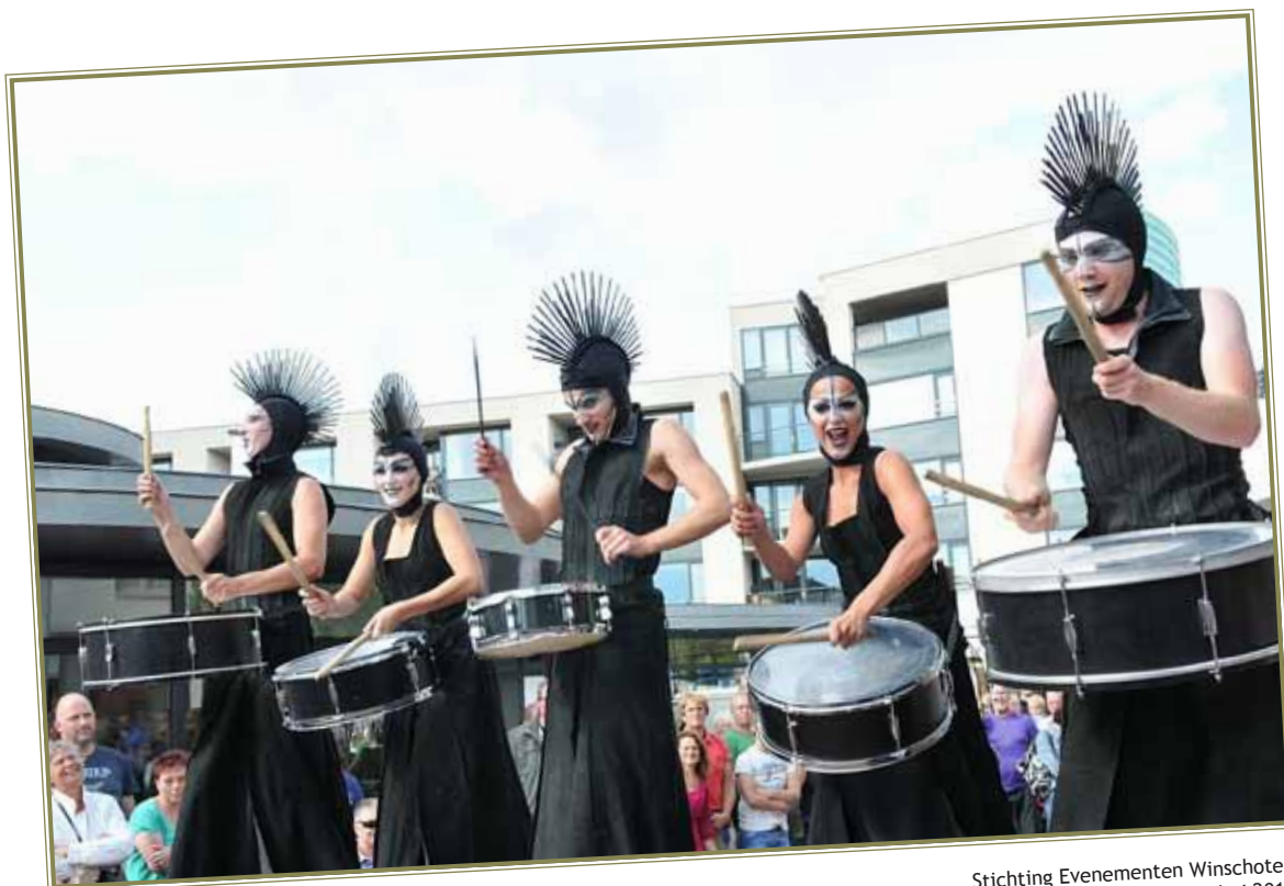
Stichting Evenementen Winschoten Straattheaterfestival Waterbei 2011

Bij twee subsidierondes in 2011 leidde het forse aantal ontvangen aanvragen tot een prioritering van positief beoordeelde aanvragen.