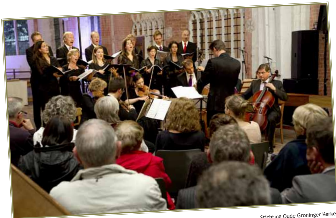
Stichting Oude Groninger Kerken Festival Terug naar het Begin 2011, slotavond Loppersum

De rol van opdrachtgever staat op gespannen voet met de beoordelende taken van de Kunstraad. Dit was ook een van de conclusies die volgden uit de evaluatie van de Kunstraad door LAGroup (zie ook pagina 20 en 21). In 2012 zal deze taak formeel komen te vervallen.