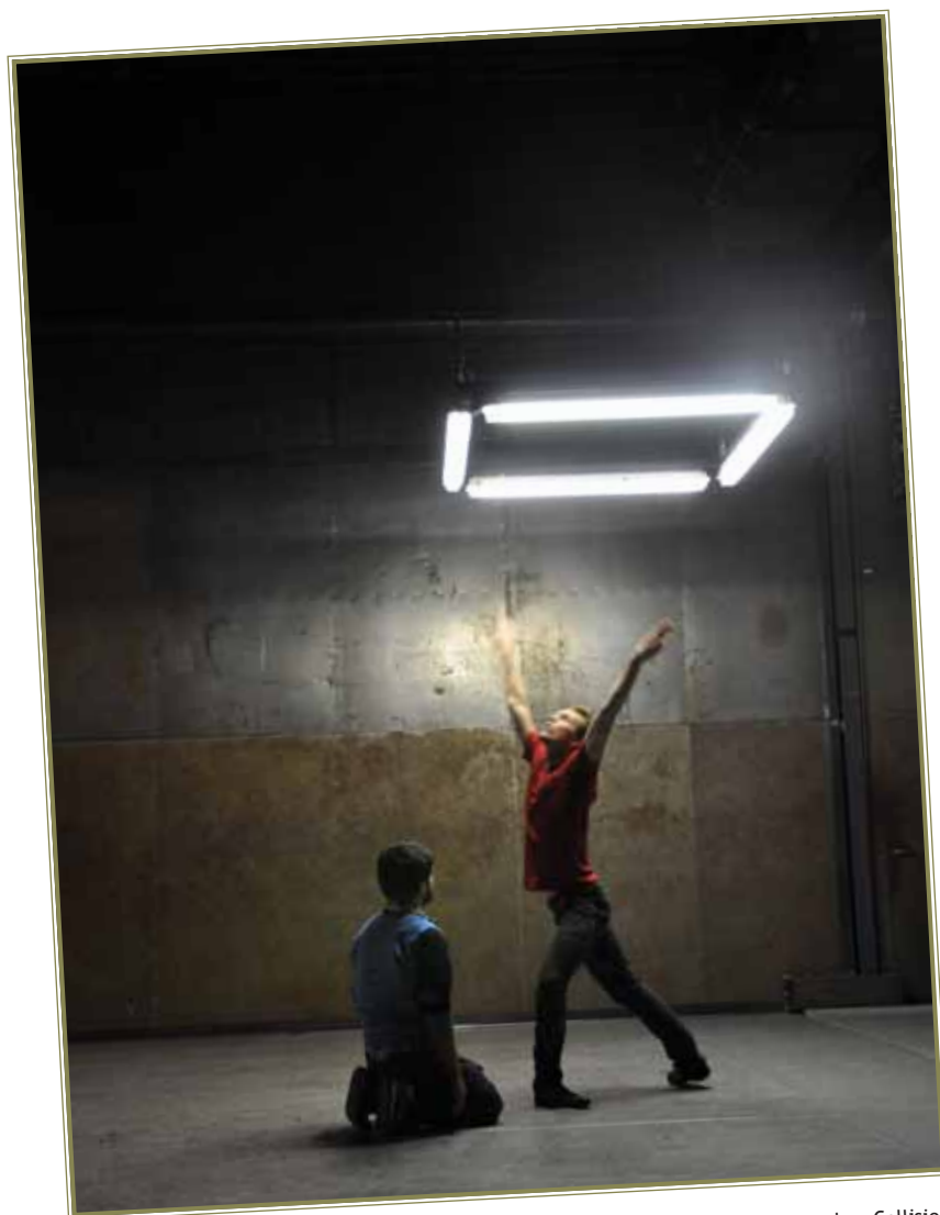
Random Collision Dansvoorstelling Hunger

In zomer en najaar oriënteerde de Kunstraad zich op de mogelijkheden van een digitaal platform voor crowd funding voor de Groningse kunsten. Daarbij is overleg gevoerd met de stichting 'voordekunst', die een website voor crowd funding beheert. Ook vonden gesprekken plaats met de beide overheden. De gemeenteraad van Groningen nam een initiatiefvoorstel aan om de Kunstraad nader onderzoek te laten doen. De Kunstraad zal, als onafhankelijk intermediair tussen een te realiseren Groningse webportal, deelnemende cultuurprojecten en het publiek, goed oog houden op het onderscheid dat moet blijven tussen de verschillende rollen. In 2012 zal de Kunstraad nader spreken en rapporteren over de mogelijkheden voor crowd funding in Groningen.